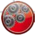
PIPE8 motorizzata PIPE8 motorized

PIPE8 is available in manual or motorized rotating version.