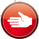
PIPE8 manuale PIPE8 manual